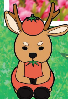
作手校舎マスコット「とまじか」